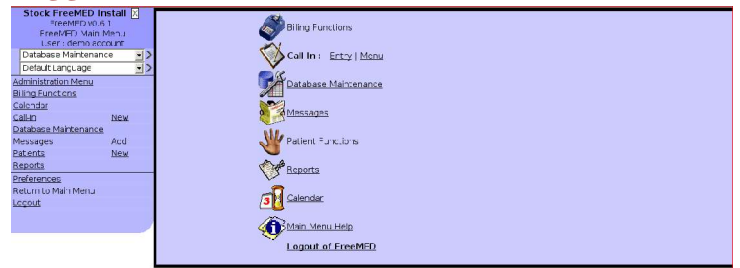
© 1999-2004 by the FreeMED Software Foundation

FreeMED est un logiciel Open Source de gestion et d'enregistrement de données médicales. Il permet de gérer la facturation, la traçabilité des données, des appels téléphoniques etc.. http://freemed.org